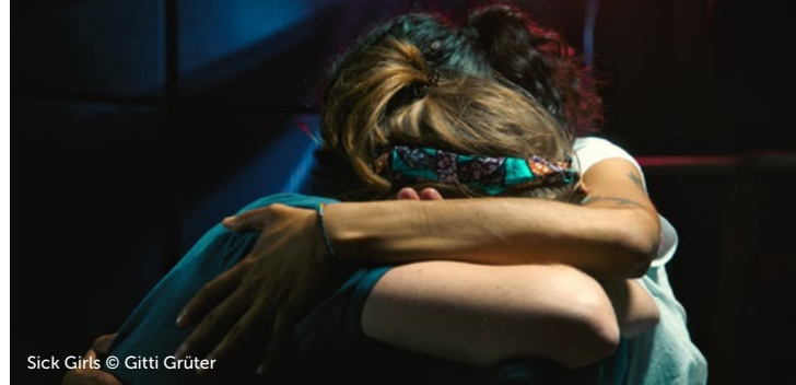
Sick Girls © Gitti Grüter