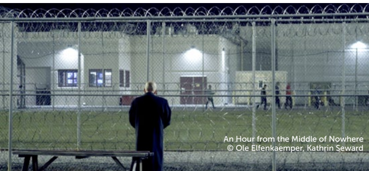
An Hour from the Middle of Nowhere © Ole Elfenkaemper, Kathrin Seward

Im Anschluss findet ein Publikumsgespräch mit Sounddesigner Fredi Tesler statt.