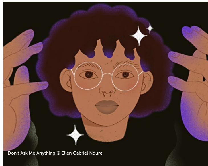
Don't Ask Me Anything © Ellen Gabriel Ndure

„ Black Savior “ zeigt eine Umkehrung globaler Machtdynamiken und parodiert gekonnt das ‚White Savior Syndrom‘: Die fiktive Akan-Familie leistet Entwicklungshilfe im Schwabenlände und versucht den schwäbischen Stamm mit einem innovativen Ziegenhilfsprojekt zu retten. Als ein „ Blindgänger “ in einer Kunstausstellung landet, will ein Sicherheitsmann das Gebäude evakuieren, was sich aufgrund von fehlender Ernsthaftigkeit der im Raum liegenden Bombe gegenüber schwieriger gestaltet als gedacht. Getrieben von inneren Dämonen findet sich der 21-jährige Melvin an einer Klippe wieder und wird von einer alten Dame im Rollstuhl von der Kante weg in „ The Last Bar “ gezogen. An diesem skurrilen Ort für Außenseiter muss er entscheiden, wie es weiter geht. Der künstlerisch anspruchsvolle Kurzfilm „ Anni “ erzählt von Auswanderung, drei Geschwistern und einer zerrissenen Familiengeschichte. An einem Sommertag denkt eine junge Frau wiederholt an vergangene Rassismuserfahrungen. Statt sich hilflos diesen Erinnerungen hinzugeben, setzt sie sich in „ Don't Ask Me Anything “ selbstbestimmt als Comic-Heldin zur Wehr.